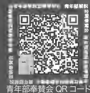
青年部奉賛会 QRコード