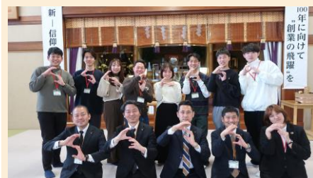
ツアー無事終了後、御霊地道場で