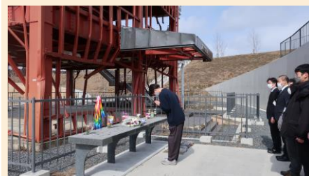
南三陸町旧防災庁舎前での慰霊