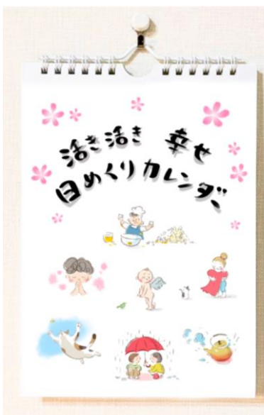
大きさ A5 (解脱誌と同サイズ)

解脱金剛奉賛会記念品としてご好評をいただいた「げだつ日めくりカレンダー」が、『生き生き幸せ日めくりカレンダー』として販売されることとなりました。