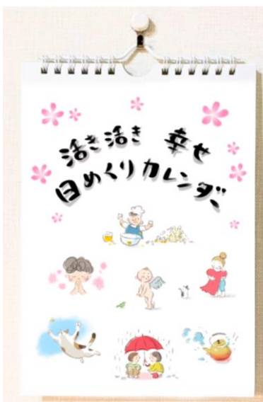
大きさ A5 (解脱誌と同サイズ)

解脱金剛奉賛会記念品としてご好評をいただいた「げだつ日めくりカレンダー」が、『生き生き幸せ日めくりカレンダー』として販売されることとなりました。